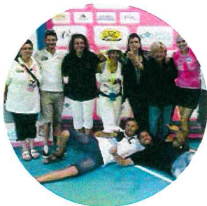
Lo Staff dell'Handbike